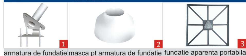
1 armatura de fundatie