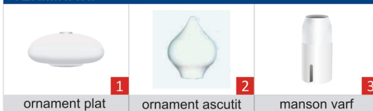
1 ornament plat